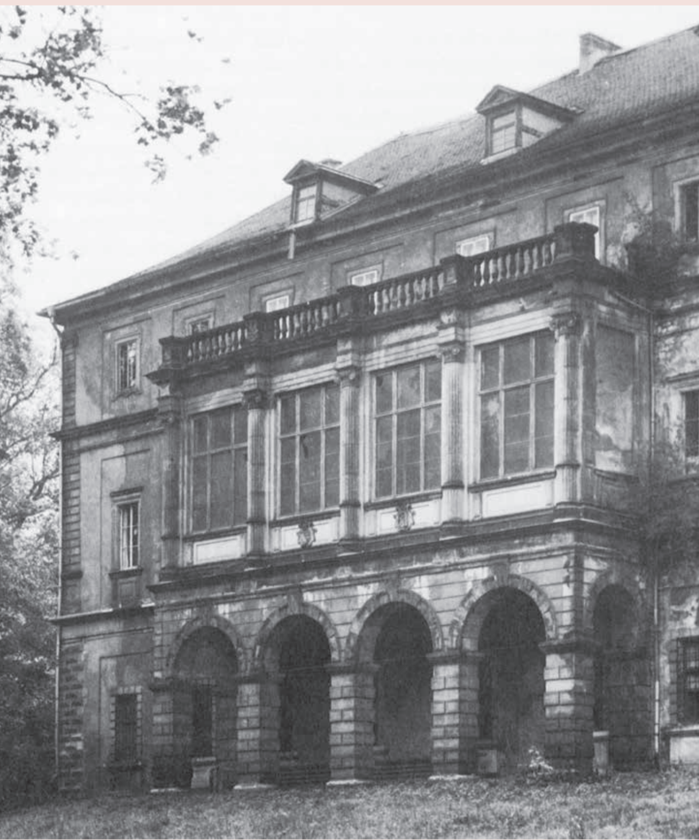
Архів Гете-Шіллера у Ваймарі