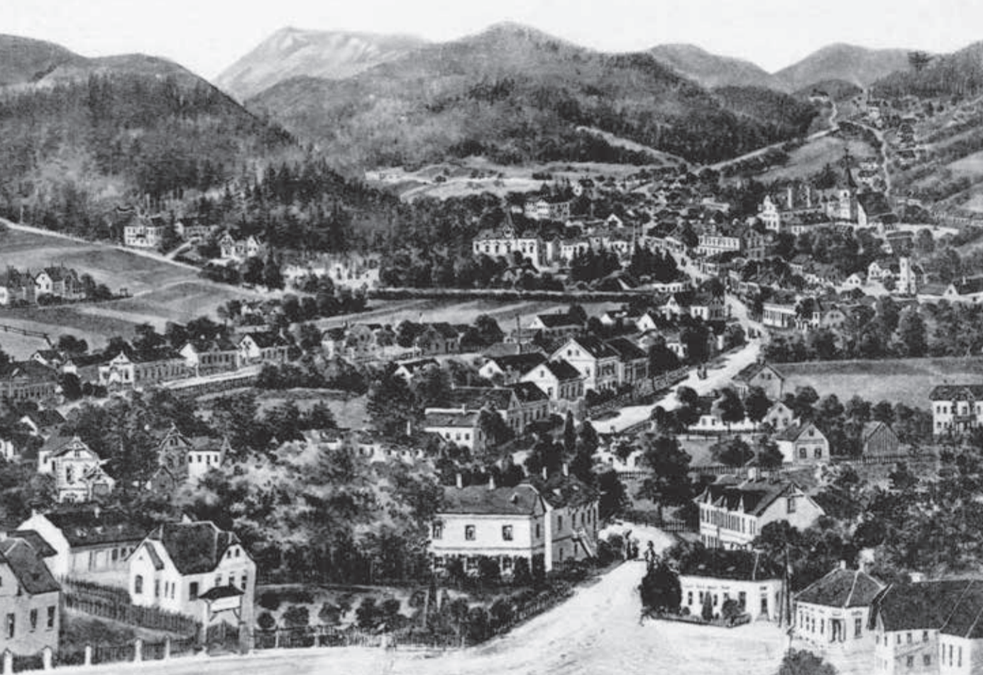
Історична світлина, Поттшах на околиці Віденської западини