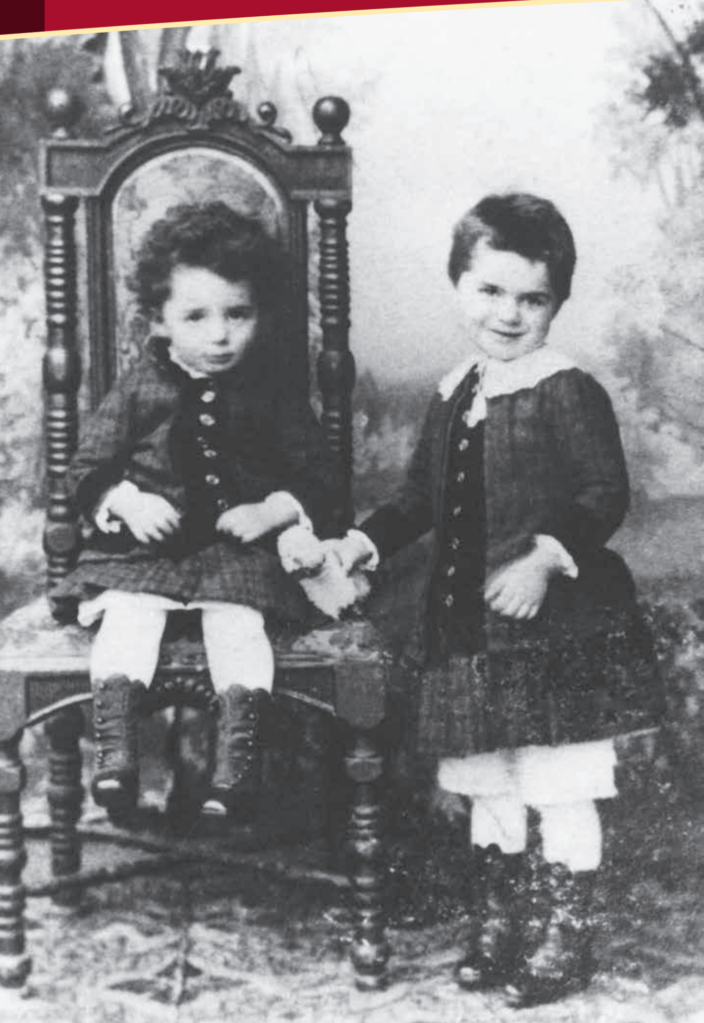
Сестра Леопольдіна (сидить) та Рудольф Штайнер (стоїть), рік 1866