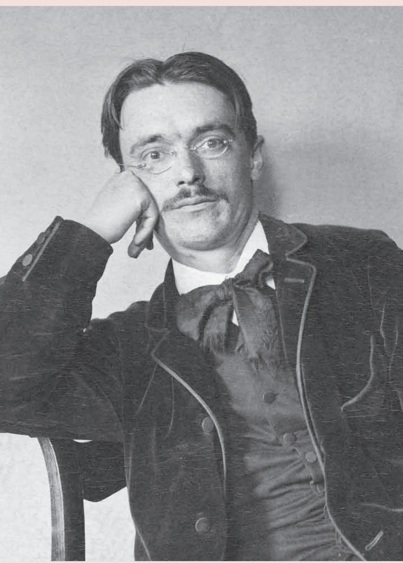
Рудольф Штайнер як співробітник в архіві Гете-Шіллера, Ваймар, 1891 р.