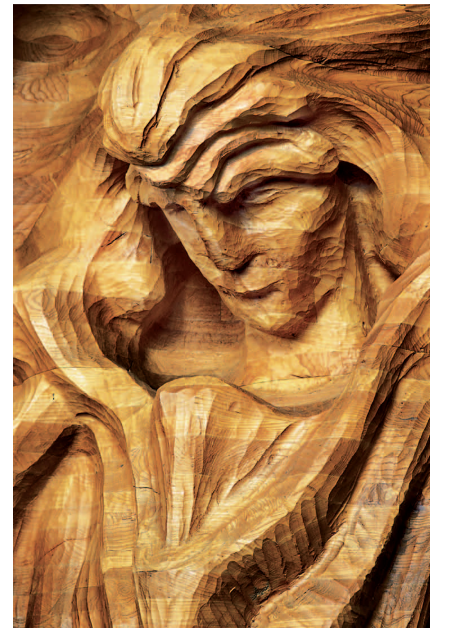
Аріманічна сутність, представник людства, люциферична сутність – Деталі скульптури Рудольфа Штайнера „Представник людства“

сприйняття на шляху учнівства. Ключ до цього знаходиться в людському Я.