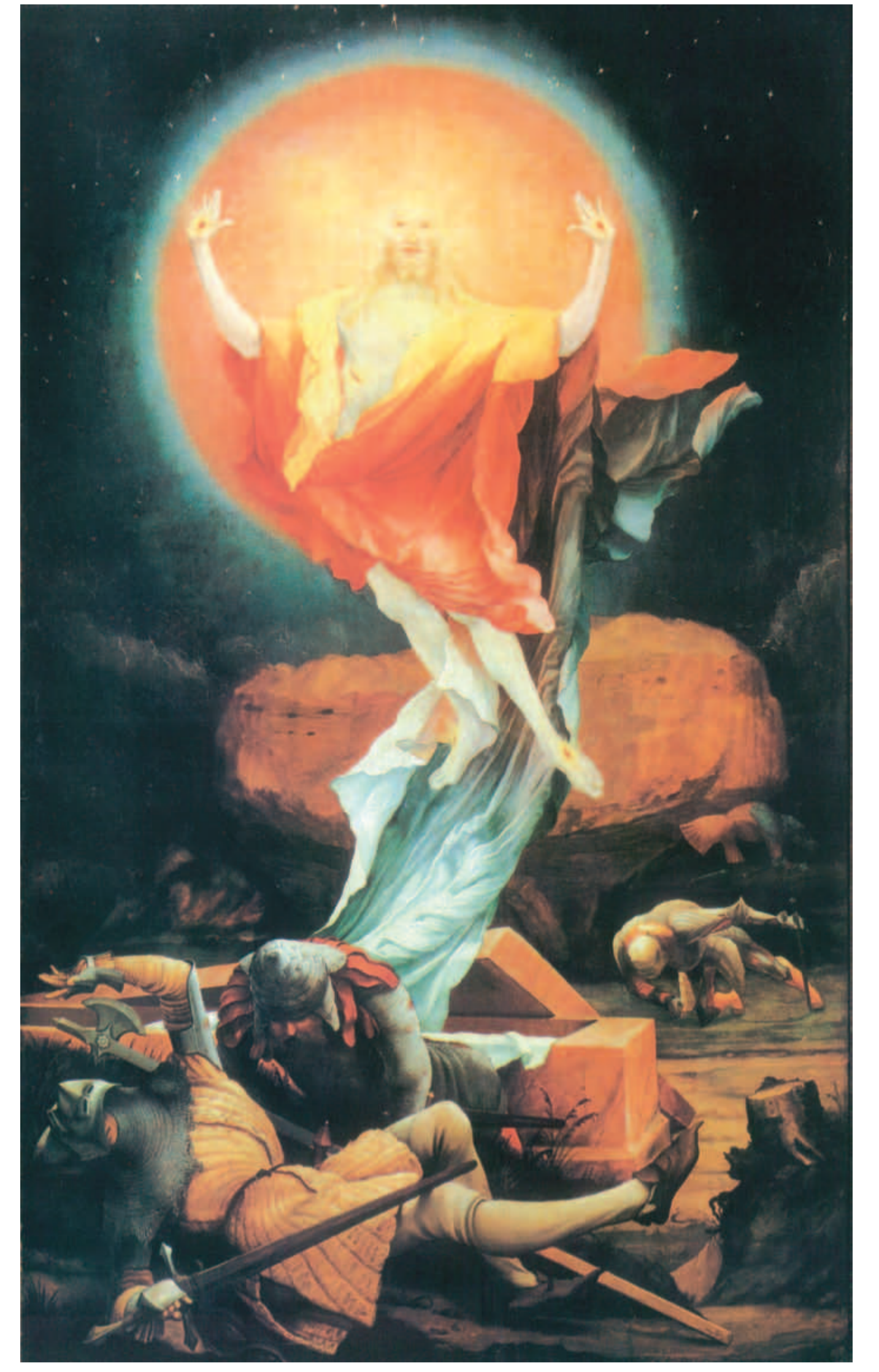
Грюневальд, Воскресіння, фрагмент картини вітваря в музеї „Unterlinden“, Кольмар (Франція)

Сьогодні з'являється все більше людей, котрі мають надчуттєві переживання, та для котрих Христос, як і для Р. Штайнера, – це не об'єкт для віри, а прожитий досвід.