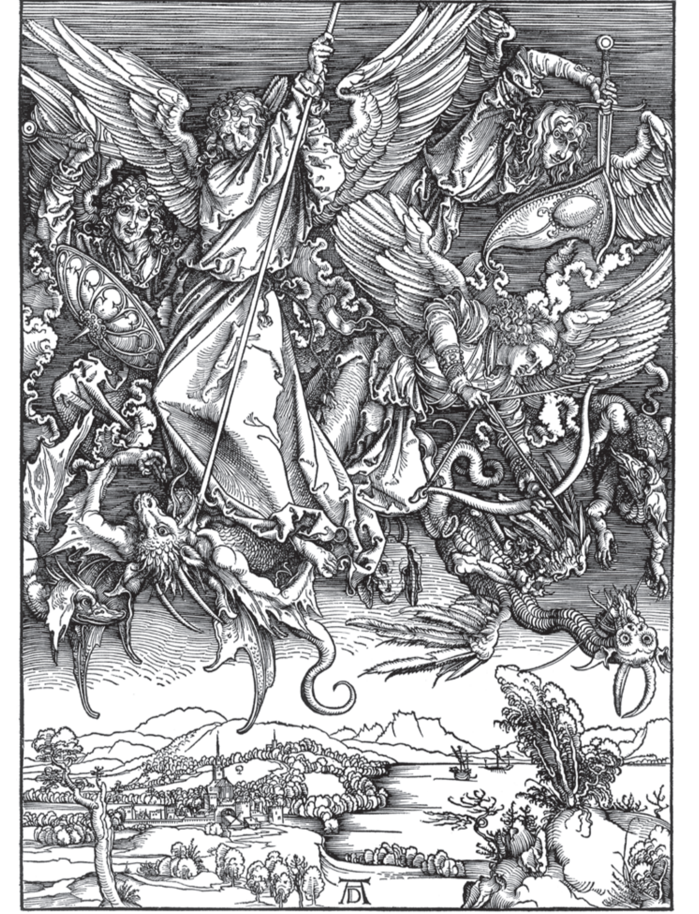
Альбрехт Дюрер, цикл „Апокаліпсис“, „Михаїл, боротьба з драконом“

Літературні джерела, повне зібрання творів (GA) Рудольфа Штайнера*: