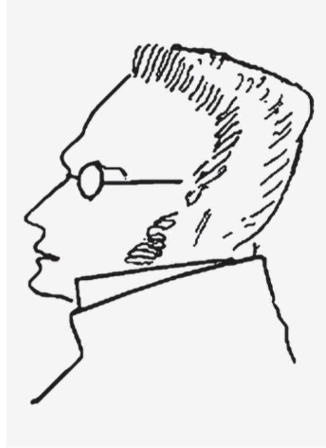
Макс Штірнер, ескіз: Ф. Енгельс

У родині Рудольфа Штайнера релігія не відіграє ніякої ролі. Батько цікавиться технікою та політикою. Штайнер у першій половині свого життя до християнства ставиться також критично. Життєво важливими питаннями для нього є пізнання, свобода й людина, котра творить. Релігійного змісту не має також і його спіритуальний досвід. Це є проникнення зором у діяльність у природі її сутностей та бачення шляху становлення людини після смерті.